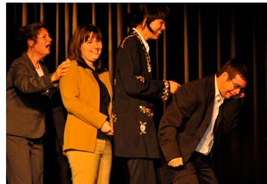
Spectacle « Allô ? tu m'entends ? » joué par les élèves de L'Atelier