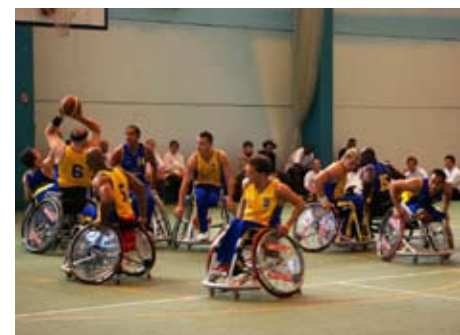
Les Aigles de Meyrin en pleine action