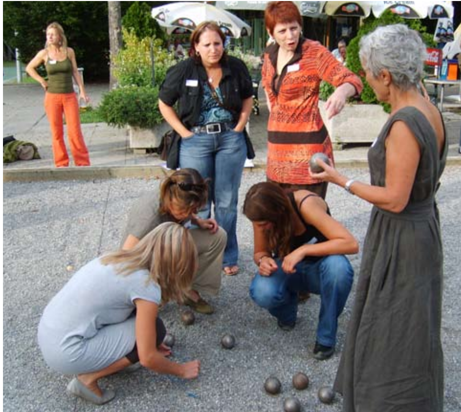
Le tournoi de pétanque 2008 au Boulodrome de Carouge a remporté un franc succès

Il a dès lors été décidé d'organiser cet événement en début d'année scolaire sous la forme d'une joute sportive !