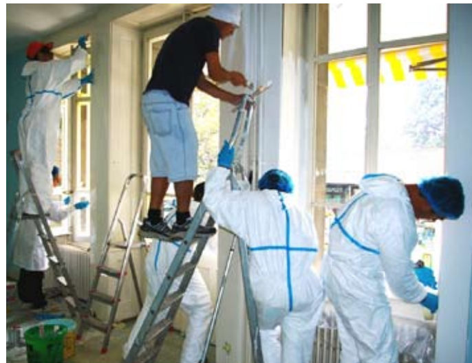
Les peintres à l'œuvre dans le « salon bleu »