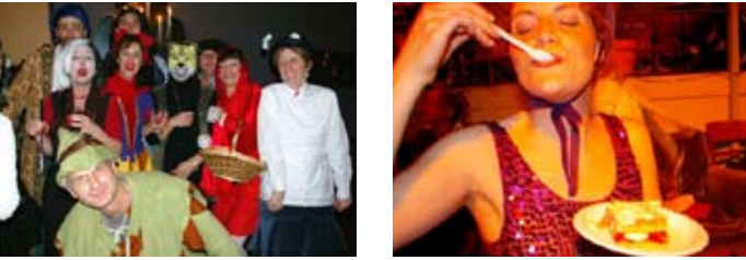
Souvenirs de la fête déguisée de 2007 sur le thème des contes et légendes

en développant des espaces et des outils susceptibles de nous inscrire dans une communauté de pratiques et de savoirs ouverts sur l'extérieur.