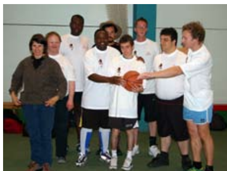
L'équipe de L'Essarde venue jouer

Après ces matchs d'introduction, a débuté le tournoi. Tout au long du week-end, une ambiance festive a régné dans la salle, ce qui fut une grande fierté pour nous. Tout s'est déroulé dans le fair-play et la bonne humeur.