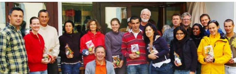
Un grand merci aux collaborateurs de Firmenich pour leur participation à cette belle journée