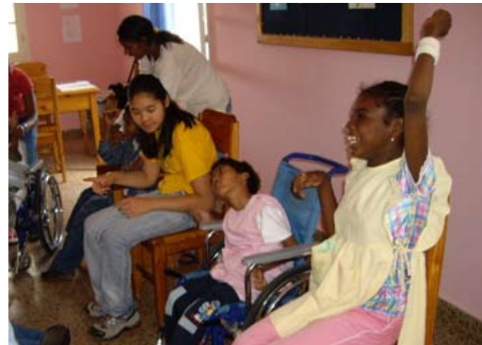
Le centre Ny Avana a besoin de soutien

Depuis, l'ASAM œuvre dans la recherche de fonds pour soutenir le développement des projets de l'APEP et contribue à faire connaître l'association malgache à l'extérieur du pays.