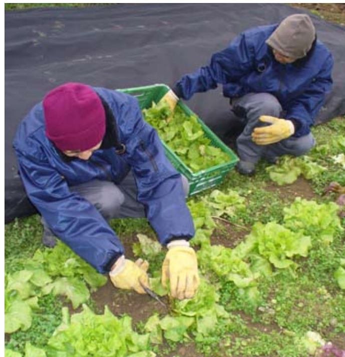
Les deux stagiaires de L'Atelier en activité

Institution de la Fondation Ensemble, L'Atelier est un centre d'enseignement pratique qui accueille des adolescents avec une déficience intellectuelle. L'accompagnement scolaire et éducatif de ces jeunes a pour objectif principal le développement de leurs compétences dans un but d'autonomie et d'intégration au sens large, en vue de préparer leur vie personnelle et professionnelle future au sein de structures spécialisées pour adultes ou tout autre lieu adapté à leurs besoins.