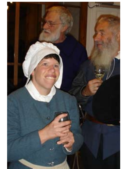
Retour sur la Fête de l'Escalade, organisée le 9 décembre 2008 à Claire Fontaine, en présence de représentants de la Compagnie 1602.