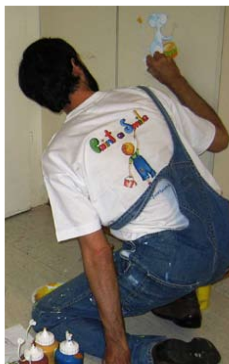
L'un des six « peintres du sourire »