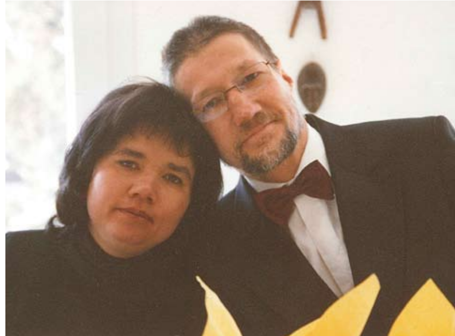
Des amitiés, des affinités, des complicités, des élans timides ou plus encore...

Au fil du temps, ce groupe s'est étoffé et un rôle plus spécifique a commencé à se dessiner.